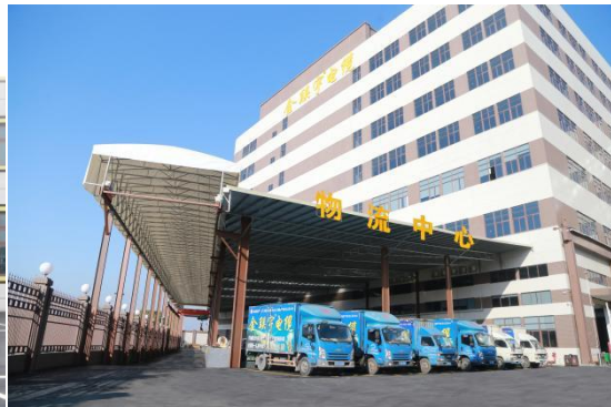
图 7、8：集团检测与研发中心、物流中心