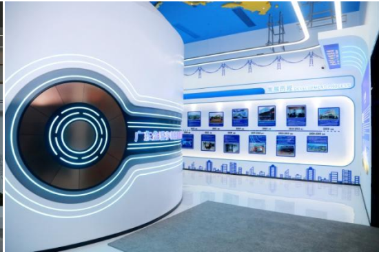
图 5、6：集团接待大厅、智能展厅