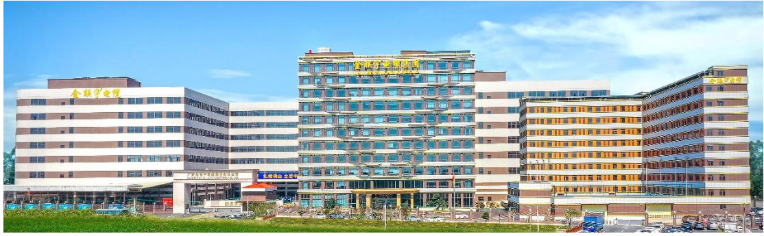
图 1、2：金联宇电缆集团总部全貌

金联宇电缆集团致力于高端环保电线电缆领域的研发创新，产品覆盖 35kV 及以下中低压电力电缆、钢丝铠装及编织屏蔽电缆、橡套电缆、电气装备用线、无卤低烟阻燃和耐火电线电缆、刚性及柔性矿物质防火电缆、控制电缆、计算机电缆、10kV 架空绝缘电缆、架空导线、弱电用线、特种电缆等。近年来积极布局新能源、智能化产业等新兴领域，自主研发新能源汽车充电桩电缆、机器人拖链电缆、光伏与储能电缆等产品，拥有产品专利超 50 项。